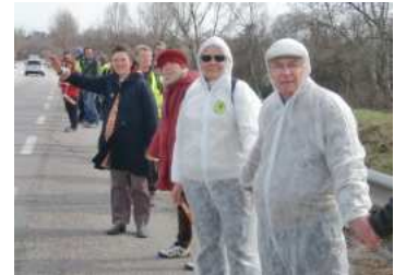
11.03.2012 : Chaîne humaine Lyon-Avignon anti-nucléaire.