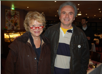
02.02.2012 : Avec Eva Joly à Vichy.