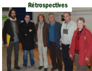
10.01.2012 : Avec Alain Lipietz à Montluçon.