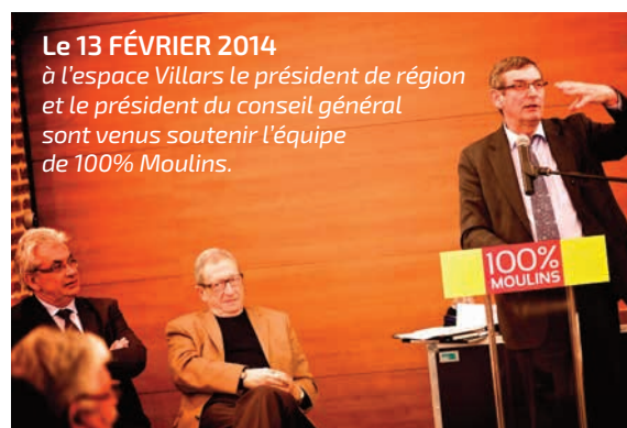
Le 13 FÉVRIER 2014 à l'espace Villars le président de région et le président du conseil général sont venus soutenir l'équipe de 100% Moulins.